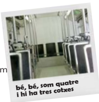
bé, bé, som quatre i hi ha tres cotxes

Els cotxes/motos devoren energia, medi ambient i, a vegades, vides. Si l'hem d'emprar omplim les cinc places . Intentem anar en transport públic -per ecologia i per si ens volem entonar- i paguem per defensar-lo. En cas que no n'hi hagi, lluitem per aconseguir-ne un de qualitat.