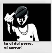
tu el del porro, al carrer!

És legal fer guerres preventives, especular o dificultar-nos l'habitatge, però està sancionat fumar-se un porro o beure alcohol en una plaça. Impliquem-nos en fomentar una legislació justa .