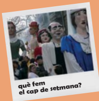
què fem el cap de setmana?