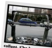
collons, t'ho has carregat!

El carrer i els seus elements no pertanyen ni a les administracions públiques ni als cotxes que l'envaeixen; és nostre, és dels infants i és de la gent gran. Tinguem cura d'allò que és públic perquè és de tothom.