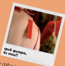
què guapo, és nou?

Intentem reduir el consum de roba innecessària i de moda. Si provenen del Sud informem-nos de si mantenen condicions de fabricació dignes .