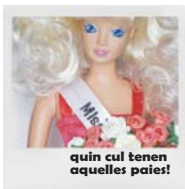
quin cul tenen aquelles paies!

Buscar rotllo està bé sempre que tothom vagi del mateix pal i es respecti l'altre/a (condó?). Si ens deixen clar que no som benvinguts o benvingudes, acceptem-ho . Pensem quin tipus de relació volem i on la podem trobar.