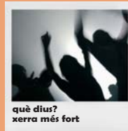
què dius? xerra més fort