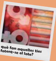
què fan aquelles ties fotent-se el lote?