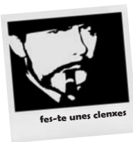
fes-te unes clenxes

La decisió de què fem amb el cos i el cervell és nostra. Amb la cocaïna se subvencionen màfies impunes, i amb les pastilles d'èxtasi, la publicitat i el màrqueting de moltes empreses. Prenem una actitud crítica davant aquests consums.