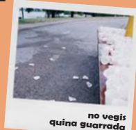
no vegis quina guarrada