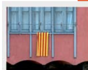
ponme dos birras

Moltes persones que treballen a l'hostaleria són d'altres terres, però per entendre i aprendre la nostra llengua cal que l'escoltin. Procurem emprar el català i ajudem a que se'l facin seu .