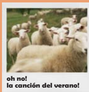
oh no! la cançió del verano!

La diversitat cultiva el pensament. No cal que ens movem sempre pels mateixos bars. Coneguem diferents músiques i ambients . Podem valorar que posin música en la nostra llengua i amb unes lletres que no idiotitzin i tinguin un discurs crític.