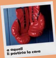
a aquell li partiria la cara

Podem ser joves sense anar sempre a tope; la festa també pot fer-se amb la calma . Demanem espais on poder parlar i estar tranquils, sense haver d'estar sempre amb un excés de soroll, de persones o d'energia.