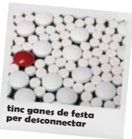
tinc ganes de festa per desconnectar