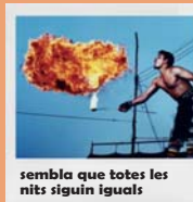
sembla que totes les nits siguin iguals

Alguns locals s'ho curren per fer-nos gaudir de l'art que creix als carrers. Acostem-nos als llocs que facin teatre, curts, exposicions, contes o música en directe ; enriquiran la nostra festa i donarem feina a gent que es busca la vida amb creativitat.