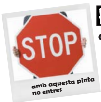
amb aquesta pinta no entres

Si ja molesta que ens repassin, encara més pagar on ens fan una radiografia per deixar-nos passar o no. Escollim els llocs amb diversitat i aquells on no ens jutgin per la marca de la caçadora, el color dels mitjons o el tipus de pentinat.