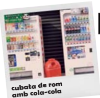
cubata de rom amb cola-cola