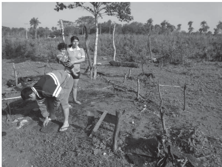
Joven familia campesina recuperando pertenencias entre los restos calcinados, días después de la entrada de la policía al asentamiento Arroyito.

El resultado fue de 94 personas detenidas, de las cuales, varios permanecieron cerca de un mes en reclusión. Los aprehendidos fueron remitidos a la jefatura de la capital departamental y recibieron tratos humillantes, obligándolos a mantener posturas incómodas, dejándolos a la intemperie y privándolos de alimento. El día del ataque, los policías accionaron con extrema violencia al golpear tanto a adultos como a niños menores de 12 años y a las mujeres que los acompañaban, destruyendo pertenencias y accediendo ilegalmente a viviendas del asentamiento. En un momento de la acción policial se escucharon disparos de armas de fuego, según testimonios. Los campesinos indicaron que fueron los policías quienes utilizaron las armas de fuego. Muchos de los detenidos tienen libertad condicional.